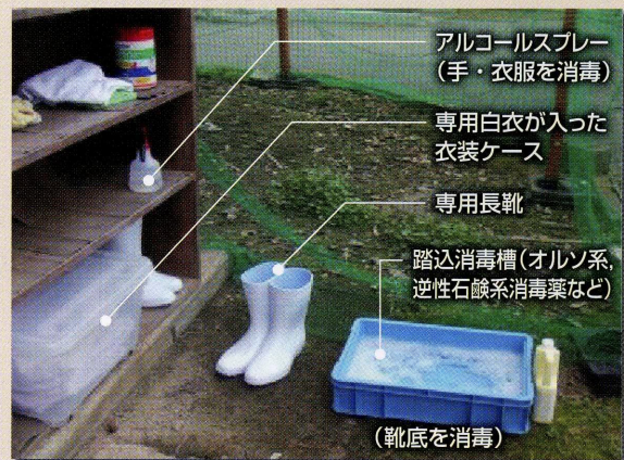
写真4 人を介したウイルス侵入対策