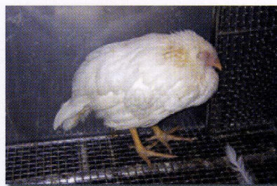
写真2 感染し、元気をなくした鶏