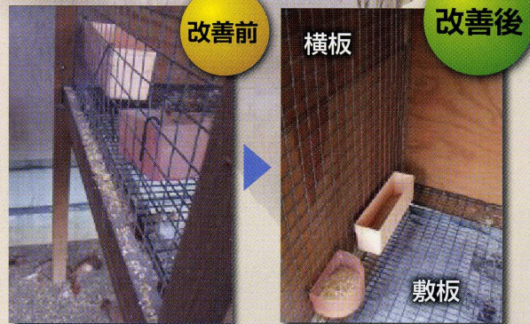
写真3 板を使った餌の散乱防止