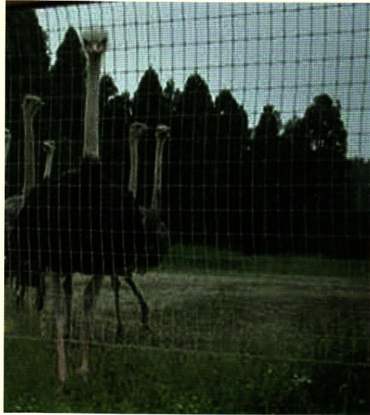
写真 金網で囲まれた中で飼育されているダチョウ