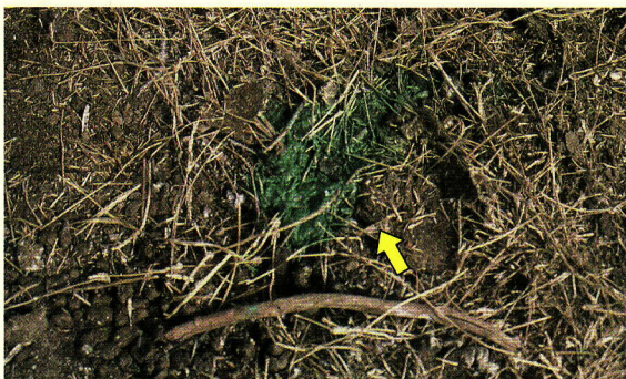
写真1 緑色化した尿 (矢印)