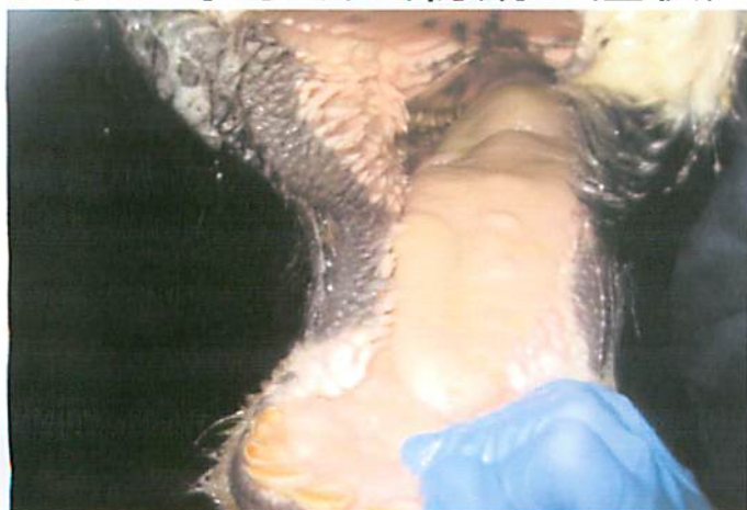
口内の水ぶくれ(初期の症状)